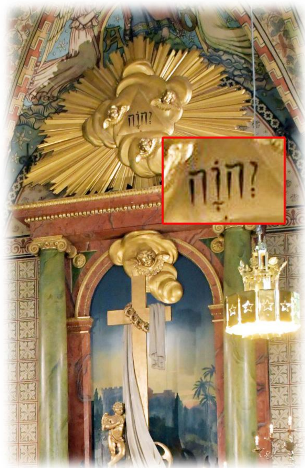
På altaruppsatsen från slutet av 1700-talet finns gudsnamnet JHWH med hebreiska bokstäver (läses från höger till vänster)

JHWH, även kallat tetragrammet eller tetragrammaton, förekommer omkring 7000 gånger i Bibelns grundtext