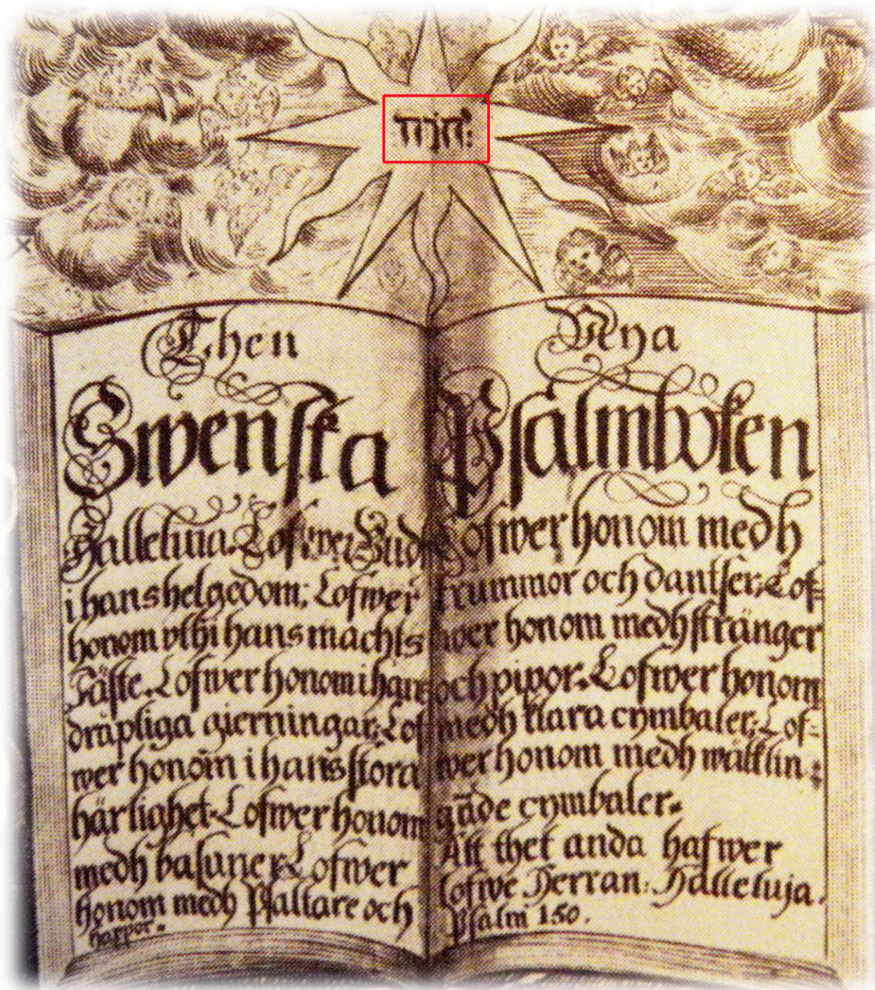
I ett psalmtryck från 1701 finns gudsnamnet JHWH med hebreiska bokstäver (Uppsala domkyrkas arkiv)