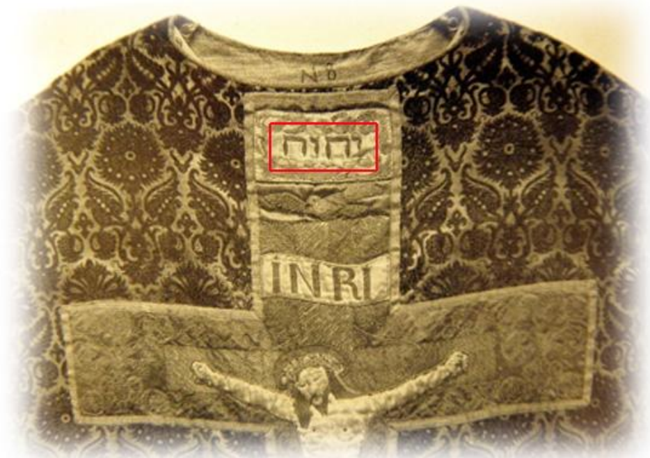
På en mässhake från 1652 finns gudsnamnet JHWH med hebreiska bokstäver