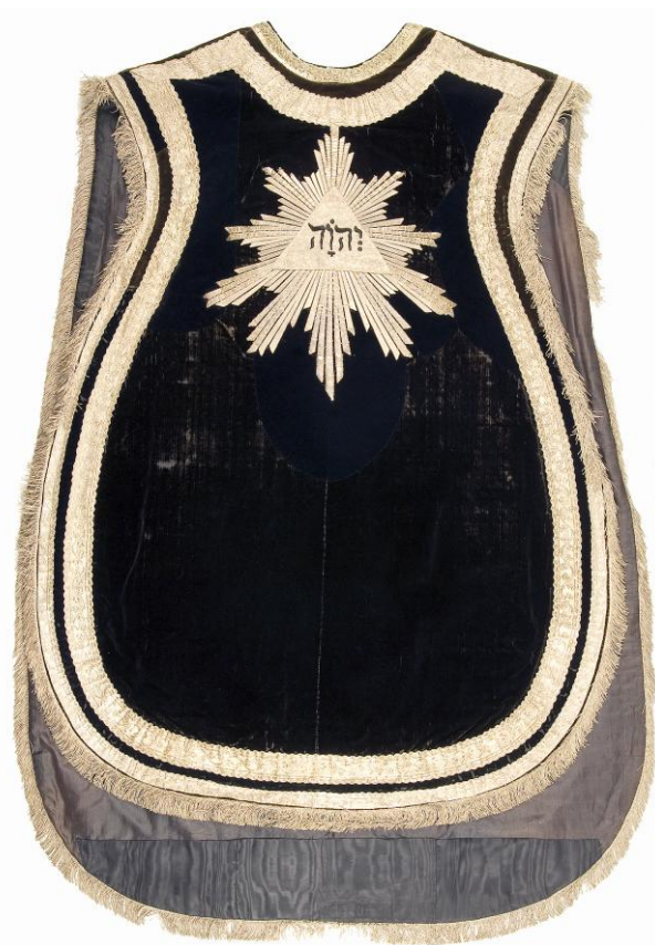
Även på två mässhakar från 1791 finns gudsnamnet JHWH med hebreiska bokstäver