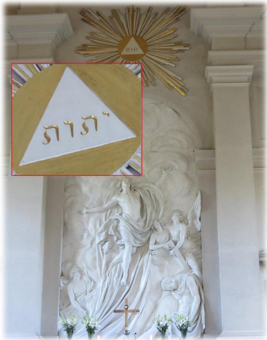
På altaruppsatsen, skapad av Johan Tobias Sergel (1740-1814), finns gudsnamnet JHWH med hebreiska bokstäver (läses från höger till vänster)

JHWH, även kallat tetragrammet eller tetragrammaton, förekommer 6828 gånger i den hebreiska texten i Bibeln