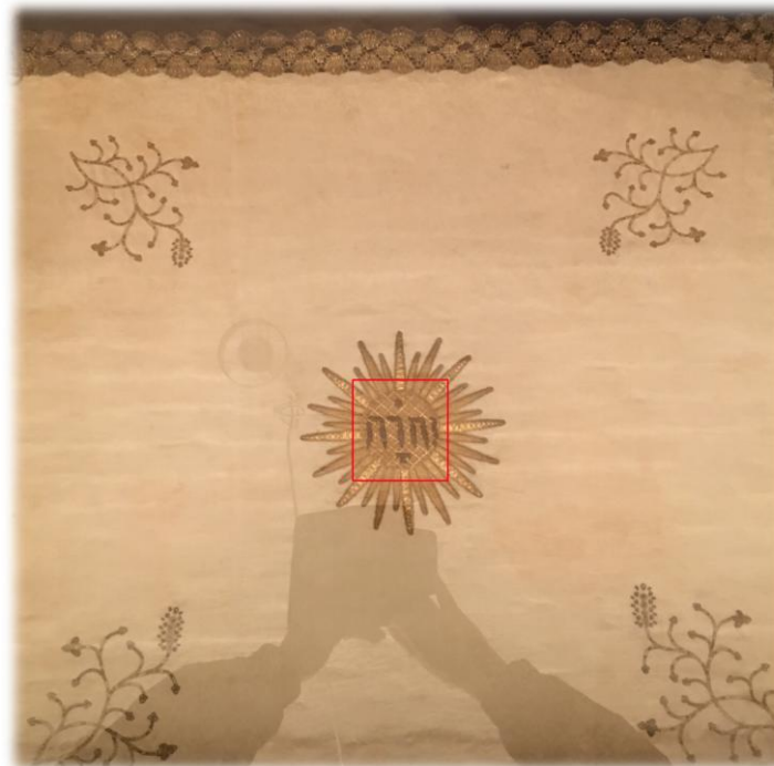
På två äldre kalkdukar finns gudsnamnet JHWH med hebreiska bokstäver

Namnet Jehova, Jehovah, Jahve eller med de hebreiska bokstäverna JHWH (JHVH) förekommer i en mängd kyrkobyggnader och på olika föremål. Gudsnamnet finns också med i betydelsen i många namn. Exempel: Jesus betyder " Jehova är räddning ". Halleluja betyder " Lovprisa Jah " (Jah är en förkortad form av Jehova)