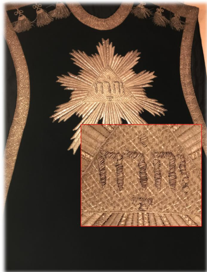
På två äldre mässhakar finns gudsnamnet JHWH med hebreiska bokstäver (den svarta från 1774)