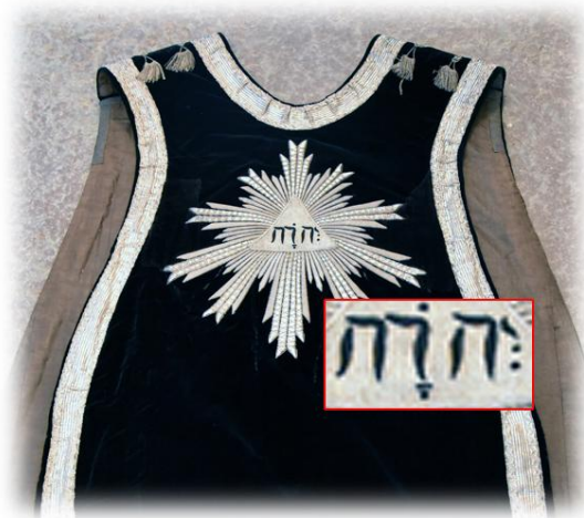
På en mässshake från 1849 finns gudsnamnet med hebreiska bokstäver

Namnet Jehova, Jehovah, Jahve eller med de hebreiska bokstäverna JHWH (JHVH) förekommer i en mängd kyrkobyggnader och på olika föremål. Gudsnamnet finns också med i betydelsen i många namn. Exempel: Jesus betyder " Jehova är räddning ". Halleluja betyder " Lovprisa Jah " (Jah är en förkortad form av Jehova)