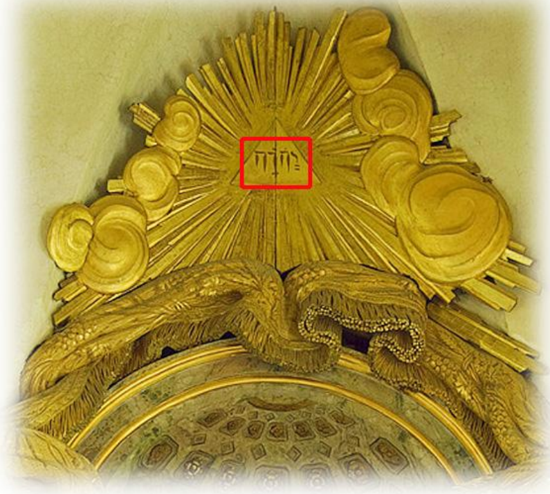
På altaruppsatsen från 1781 finns gudsnamnet JHWH med hebreiska bokstäver