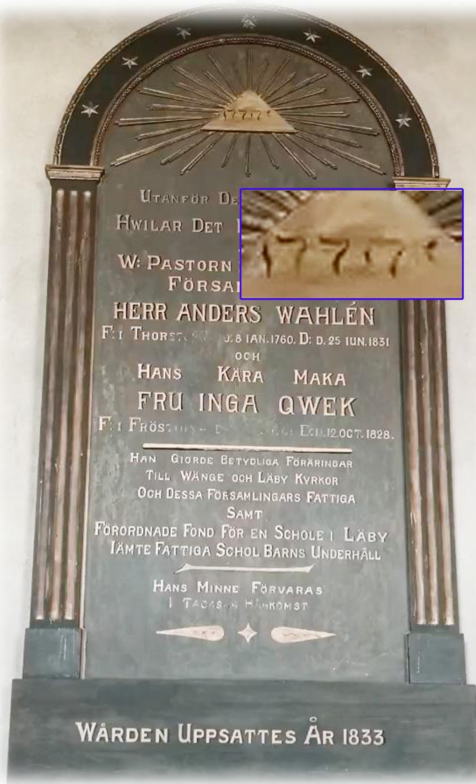
På ett epitafium från 1833 finns gudsnamnet JHWH med hebreiska bokstäver

JHWH, även kallat tetragrammet eller tetragrammaton, förekommer omkring 7000 gånger i Bibelns grundtext