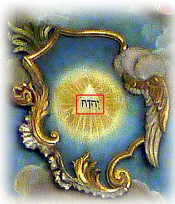
På orgeln från 1840-talet finns gudsnamnet och även på en äldre altartavla

Namnet Jehova, Jehovah, Jahve eller med de hebreiska bokstäverna JHWH (JHVH) förekommer i en mängd kyrkobyggnader och på olika föremål. Gudsnamnet finns också med i betydelsen i många namn. Exempel: Jesus betyder ” Jehova är räddning ”. Halleluja betyder ” Lovprisa Jah ” (Jah är en förkortad form av Jehova)