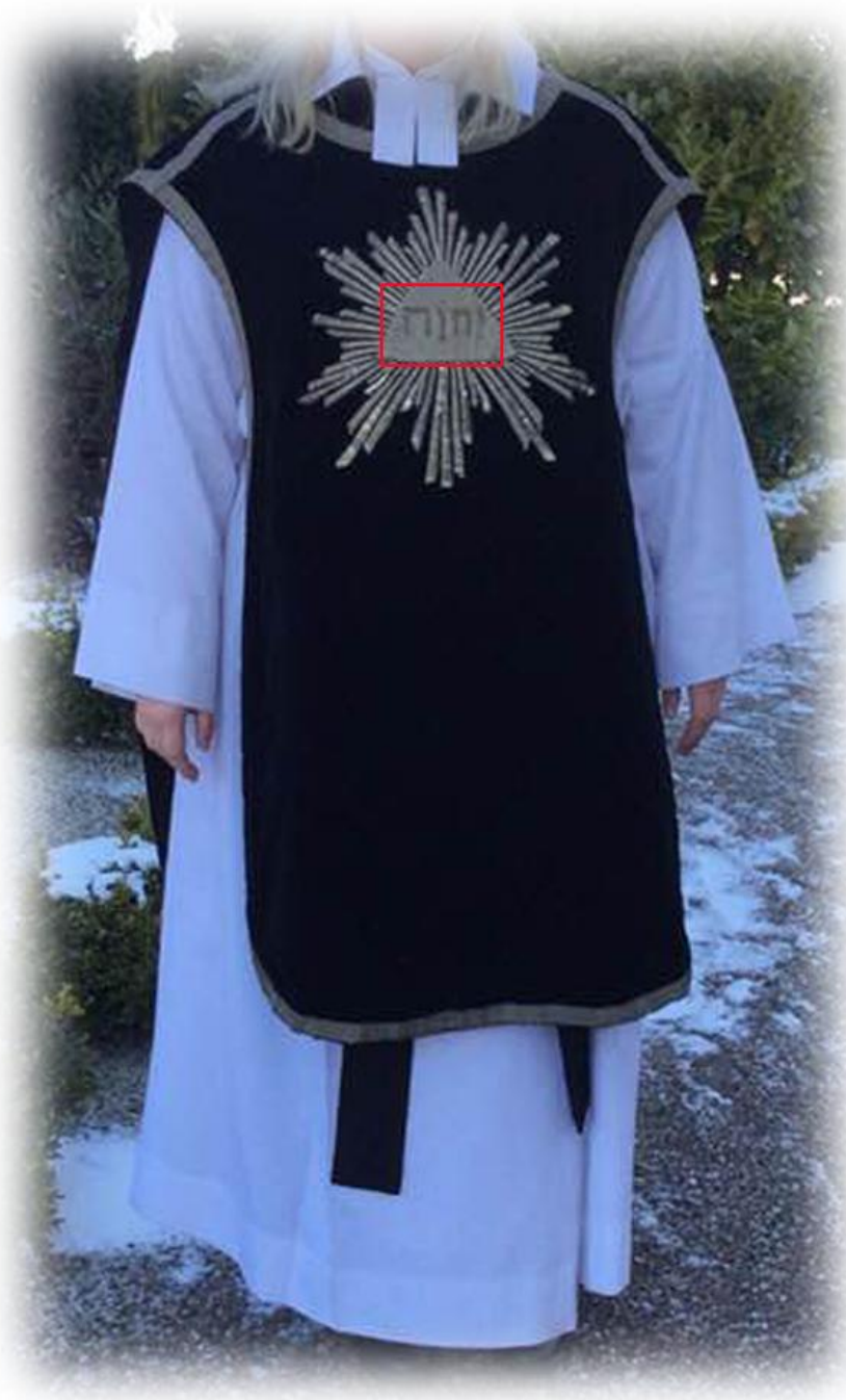
På en äldre mässhake finns gudsnamnet JHWH med hebreiska bokstäver

Namnet Jehova, Jehovah, Jahve eller med de hebreiska bokstäverna JHWH (JHVH) förekommer i en mängd kyrkobyggnader och på olika föremål. Gudsnamnet finns också med i betydelsen i många namn. Exempel: Jesus betyder " Jehova är räddning ". Halleluja betyder " Lovprisa Jah " (Jah är en förkortad form av Jehova)