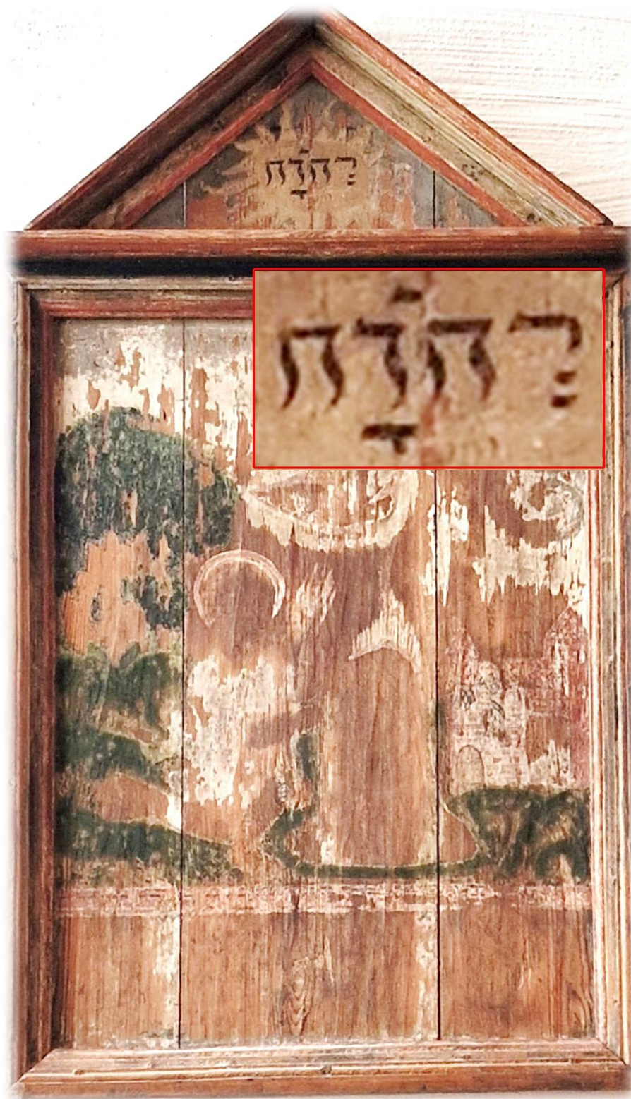
På ett epitafium från 1400-talet finns gudsnamnet JHWH med hebreiska bokstäver (läses från höger till vänster)

JHWH, även kallat tetragrammet eller tetragrammaton, förekommer omkring 7000 gånger i Bibelns grundtext