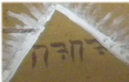
På altarpupsatsen från slutet av 1500-talet finns gudsnamnet JHWH med hebreiska bokstäver (läses från höger till vänster)

Namnet Jehova, Jehovah, Jahve eller med de hebreiska bokstäverna JHWH (JHVH) förekommer i en mängd kyrkobyggnader och på olika föremål. Gudsnamnet finns också med i betydelsen i många namn. Exempel: Jesus betyder " Jehova är räddning ". Halleluja betyder " Lovprisa Jah " (Jah är en förkortad form av Jehova)