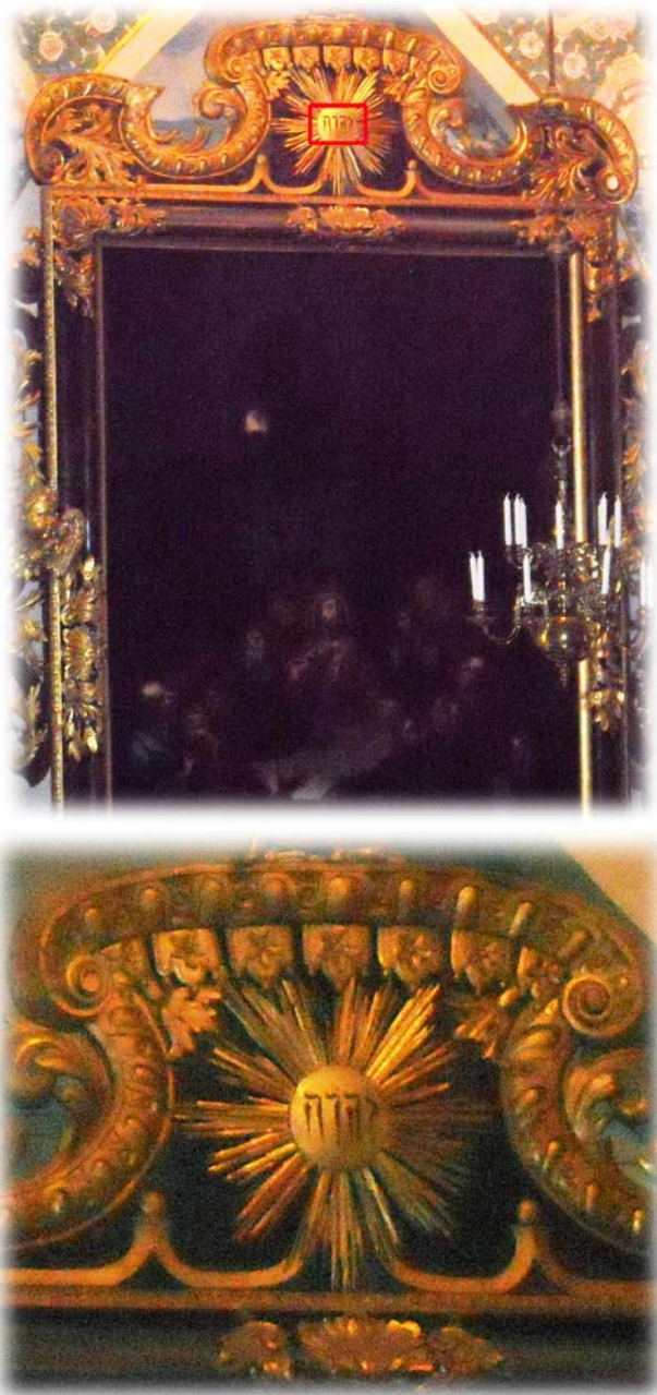
På altartavlan, som skänktes till kyrkan 1738, finns gudsnamnet JHWH med hebreiska bokstäver

Namnet Jehova, Jehovah, Jahve eller med de hebreiska bokstäverna JHWH (JHVH) förekommer i en mängd kyrkobyggnader och på olika föremål. Gudsnamnet finns också med i betydelsen i många namn. Exempel: Jesus betyder " Jehova är räddning ". Halleluja betyder " Lovprisa Jah " (Jah är en förkortad form av Jehova)