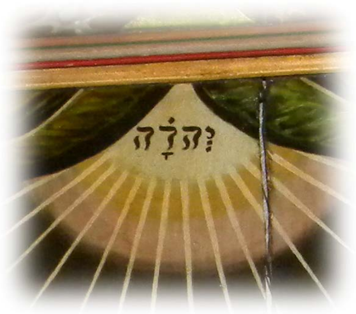
På detta epitafium från 1664 finns gudsnamnet JHWH med hebreiska bokstäver