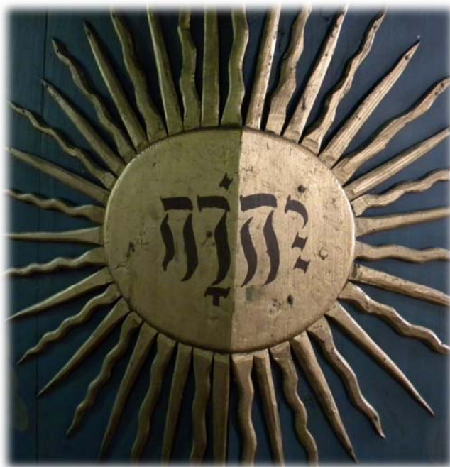
På predikstolen från 1737 finns gudsnamnet JHWH med hebreiska bokstäver (läses från höger till vänster)