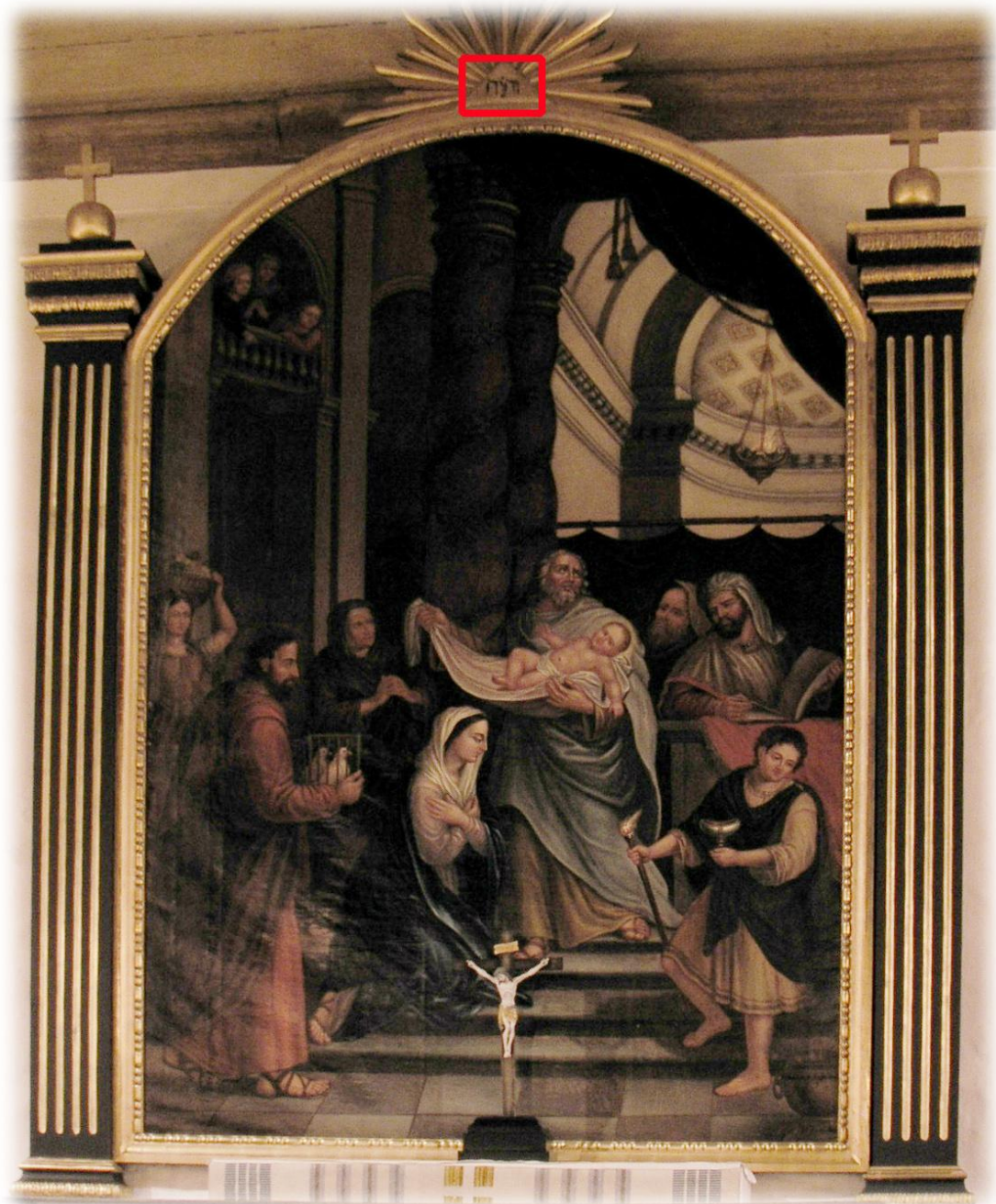
Ovanför altartavlan från 1851 finns gudsnamnet JHWH med hebreiska bokstäver

Namnet Jehova, Jehovah, Jahve eller med de hebreiska bokstäverna JHWH (JHVH) förekommer i en mängd kyrkobyggnader och på olika föremål. Gudsnamnet finns också med i betydelsen i många namn. Exempel: Jesus betyder " Jehova är räddning ". Halleluja betyder " Lovprisa Jah " (Jah är en förkortad form av Jehova)