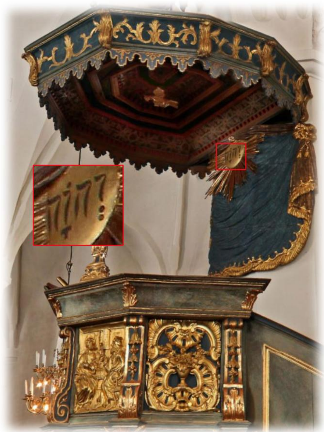
På predikstolen från 1756 finns gudsnamnet JHWH med hebreiska bokstäver (läses från höger till vänster)

JHWH, även kallat tetragrammet eller tetragrammaton, förekommer omkring 7000 gånger i Bibelns grundtext