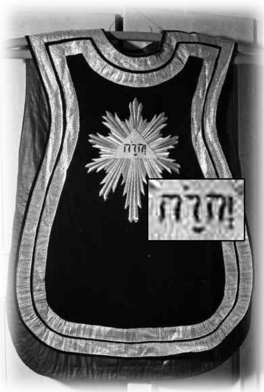
På en äldre mässhake finns gudsnamnet JHWH med hebreiska bokstäver

Namnet Jehova, Jehovah, Jahve eller med de hebreiska bokstäverna JHWH (JHVH) förekommer i en mängd kyrkobyggnader och på olika föremål. Gudsnamnet finns också med i betydelsen i många namn. Exempel: Jesus betyder " Jehova är räddning ". Halleluja betyder " Lovprisa Jah " (Jah är en förkortad form av Jehova)