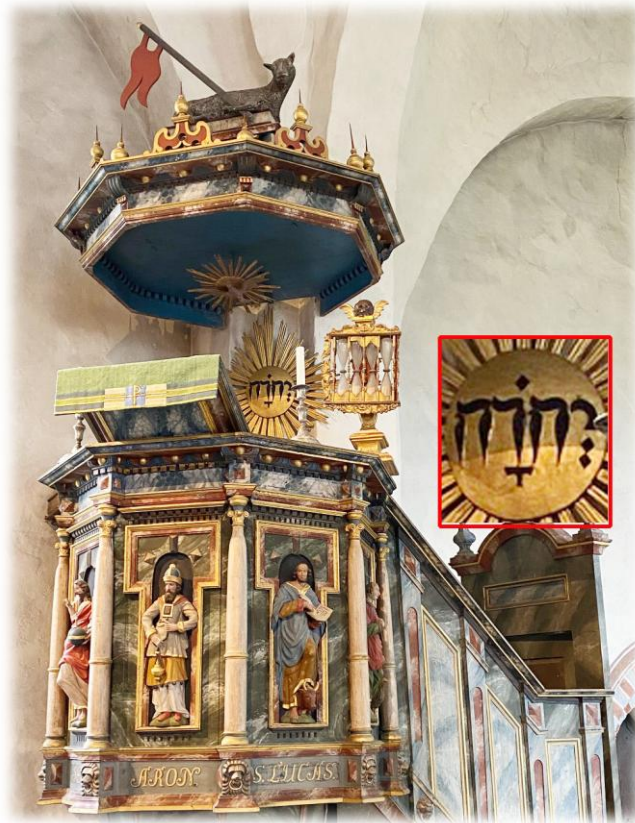
Vid predikstolen från 1640-talet finns gudsnamnet JHWH med hebreiska bokstäver (läses från höger till vänster)

JHWH, även kallat tetragrammet eller tetragrammaton, förekommer omkring 7000 gånger i Bibelns grundtext