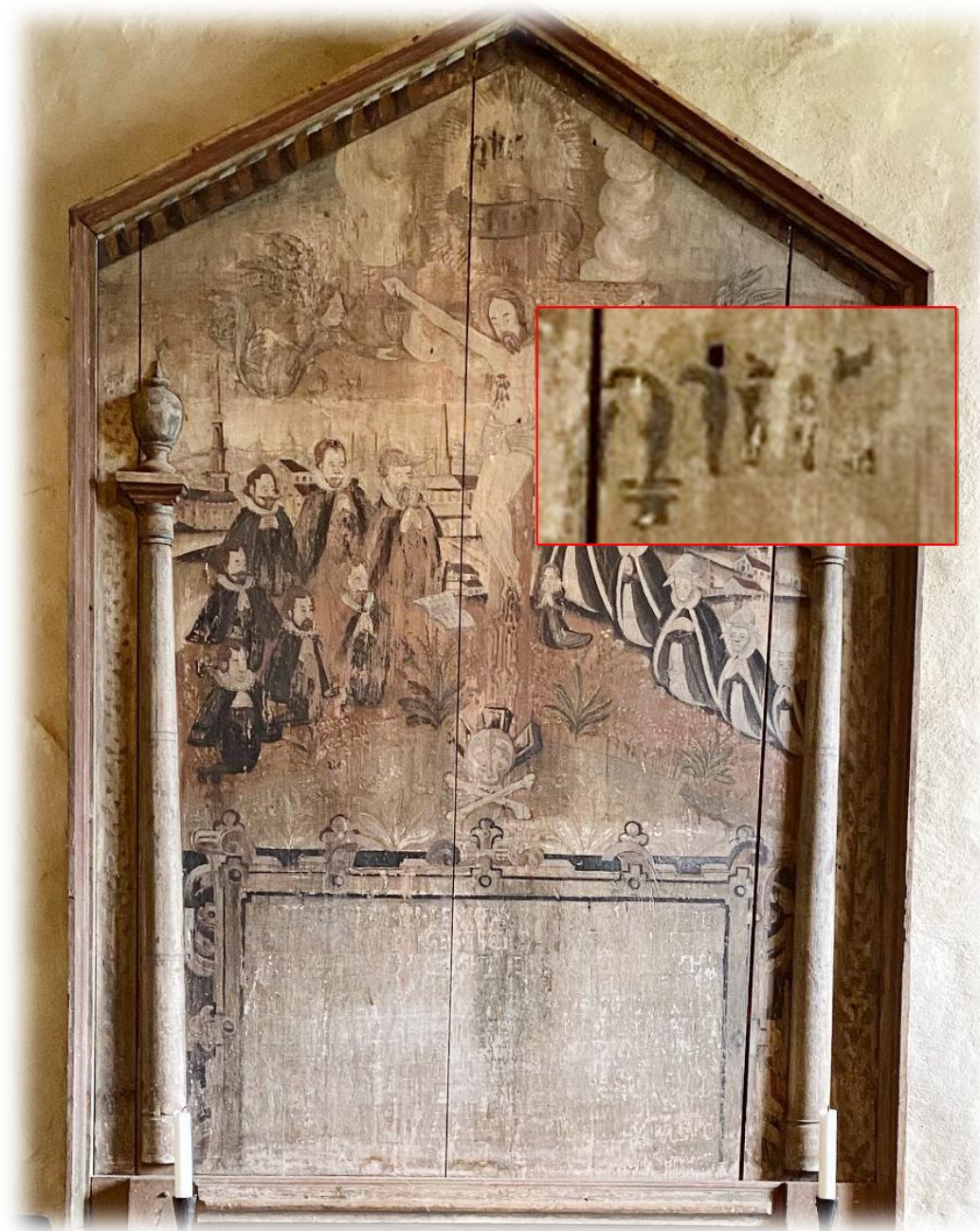
På en tavla finns gudsnamnet JHWH med hebreiska bokstäver

Namnet Jehova, Jehovah, Jahve eller med de hebreiska bokstäverna JHWH (JHVH) förekommer i en mängd kyrkobyggnader och på olika föremål. Gudsnamnet finns också med i betydelsen i många namn. Exempel: Jesus betyder " Jehova är räddning ". Halleluja betyder " Lovprisa Jah " (Jah är en förkortad form av Jehova)