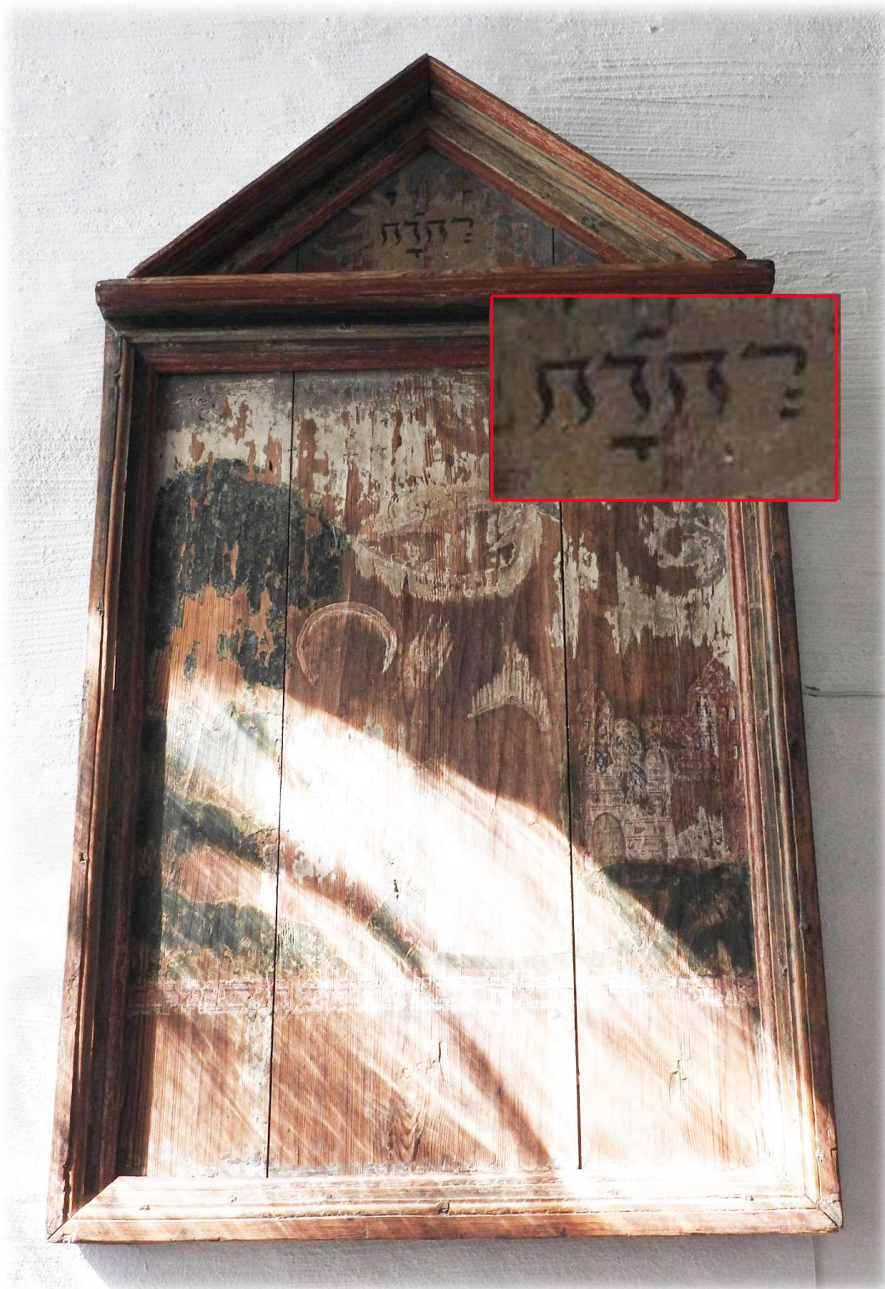
På ett skadat epitafium över en okänd person finns gudsnamnet JHWH med hebreiska bokstäver

Namnet Jehova, Jehovah, Jahve eller med de hebreiska bokstäverna JHWH (JHVH) förekommer i en mängd kyrkobyggnader och på olika föremål. Gudsnamnet finns också med i betydelsen i många namn. Exempel: Jesus betyder " Jehova är räddning ". Halleluja betyder " Lovprisa Jah " (Jah är en förkortad form av Jehova)